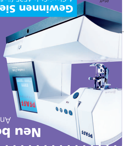
Pfaff creative 2144

Fordern Sie an Gratis: Neues Schulpaket für den Nähunterricht