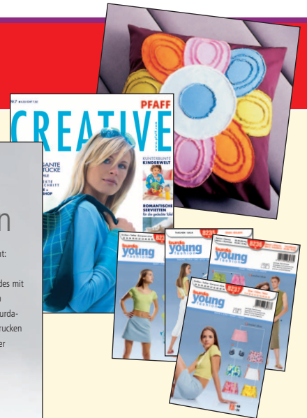
CD, Pfaff creative Magazin, burda-Fertigschnitte und mehr: Ein Schulpaket, das Lust aufs Nähen macht! Solange Vorrat reicht