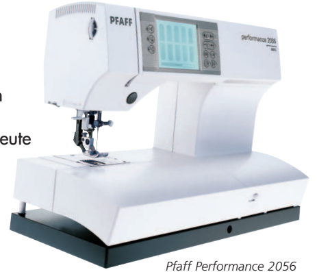
Pfaff Performance 2056

Attraktive Unterrichtshilfen fördern den Spaß am Lernen. Moderne Nähmaschinen gehören dazu, weil die Freude am selbst gestalten Kreativität weckt und Erfolge stolz machen. Deshalb bietet Pfaff jetzt neu ein Leasing-Paket exklusiv für Schulen an. Kalkulierbare Ratenzahlungen über 36 Monate mit festgelegtem Restwert machen den Erwerb von modernen Nähmaschinen, bis hin zu den begehrten Näh- und Stickmaschinen, wesentlich einfacher. Das von Pfaff speziell für Schulen entwickelte Leasingpaket ermöglicht die Technik in den Schulen, die junge Leute fasziniert. Ganz abgesehen davon, dass Ihre Schülerinnen und Schüler stets mit den neuesten Nähmaschinen arbeiten. Haben wir Sie neugierig gemacht? Einfach die Antwortkarte ausgefüllt an uns zurückschicken, wir informieren Sie gerne!